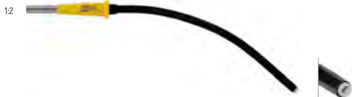
Электрод для аргонусиленной коагуляции, изогнутый, рабочая длина 110 мм, прямой факел Argon coagulation electrode, angled, working length 110 mm, axial beam