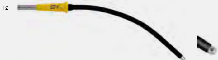
Электрод для аргонусиленной коагуляции, изогнутый, рабочая длина 110 мм, боковой факел Argon coagulation electrode, angled, working length 110 mm, lateral beam